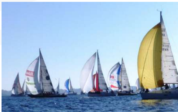
Régate des IUT 15 e Edition

Depuis 2004, la Régate des IUT réunit des équipes de toute la France autour de la voile, avec deux challenges passionnants : le challenge voile et le challenge communication.